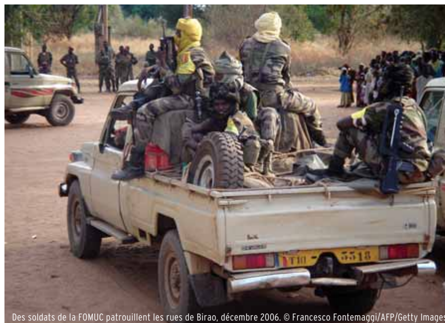
Des soldats de la FOMUC patrouillent les rues de Birao, décembre 2006.

Il est difficile de quantifier le soutien soudanais apporté aux éléments armés basés dans le nord-est de la RCA notamment car ils ne constituent pas une entité homogène. Certains ont reçu un entraînement militaire (à l'intérieur comme à l'extérieur du Soudan) mais d'autres affirment avoir été enrôlés de force dans leur village d'origine en RCA. 29 Les chefs rebelles possédaient des téléphones satellites Thuraya et les troupes portaient des armes de petit calibre mais peu d'autres types d'armement. Les opérations étaient dirigées vers des sites munis de stocks d'armes qu'ils pouvaient saisir tels que les bases des FACA à Birao ou Ouanda Djallé. Ils ont également confisqué des armes de petit calibre grâce à un programme anti-braconnage (principalement des AK-47, quelques fusils d'assaut automatiques FAL et G3, des pistolets mitrailleurs MAT49 et des fusils à répétition MAS-36). 30