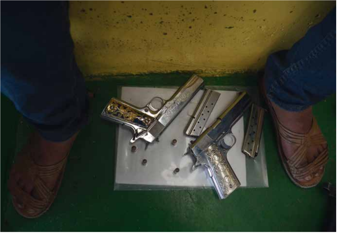
مالك سلاح ينتظر دوره خلال برنامج تسجيل الأسلحة النارية، نويفا إيطاليا، المكسيك، نيسان/ أبريل 2014.

أحياناً ما يُشتبه في عدم الإبلاغ عنها (Wellford, Pepper, and Petrie, 2005) ص 37-34، 57-58). في الولايات المتحدة، على سبيل المثال، هناك اتجاه متزايد بين مالكي الأسلحة لرفض الإجابة على المسوحات بشأن حيازة الأسلحة النارية (Urbatsch, 2018). نتيجة لذلك، تُدمج نتائج المسح، مثل مقاييس الحيازة الأخرى، مع بيانات المصادر الأخرى كلما أمكن ذلك.