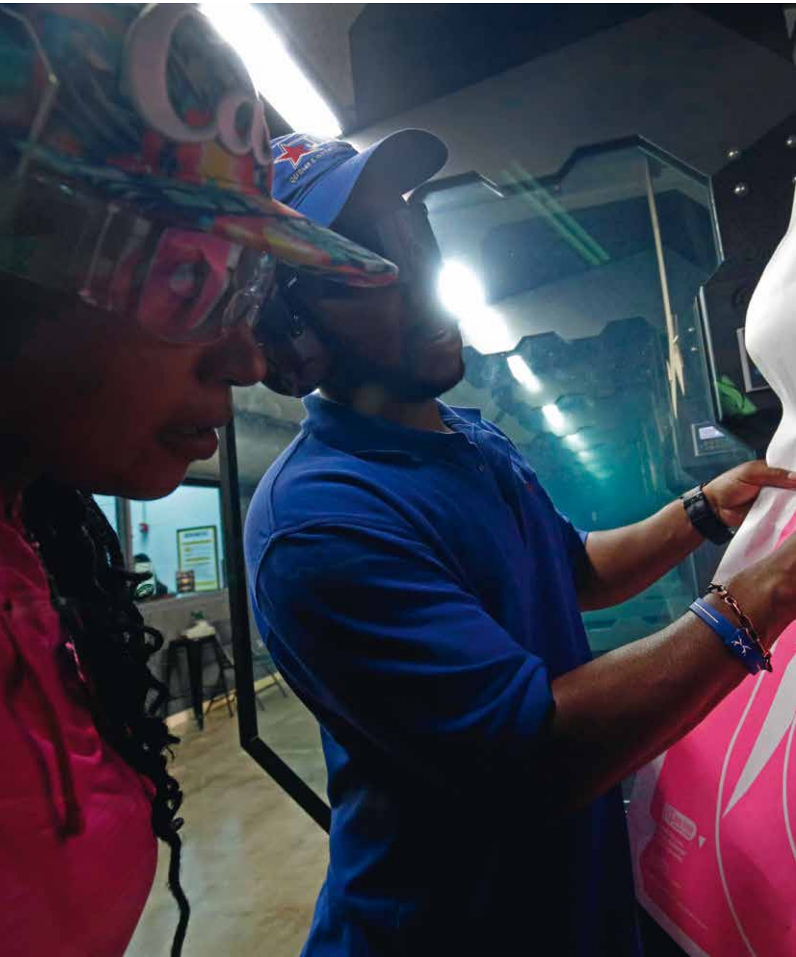
امراة تستمع إلى تعليمات حول تدريبها على الرماية لاختبار الحصول على شهادة حمل السلاح المُخبأ، إلينوي، الولايات المتحدة، تموز/ يوليو 2017.