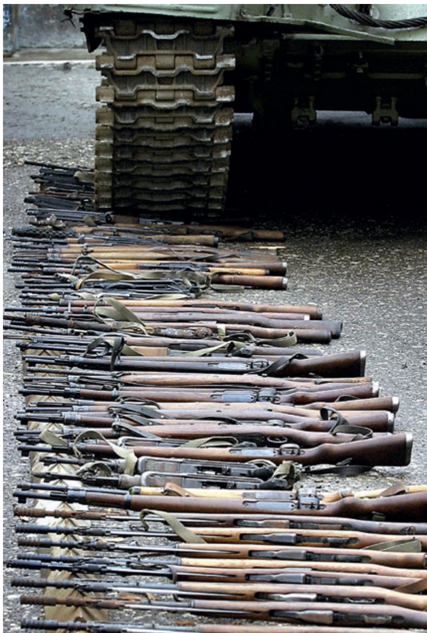
Dstrucción de fusiles de posesión ilegal en el marco de una recolección de armas organizada por la SFOR de la OTAN, Banja Luka, abril de 2004.