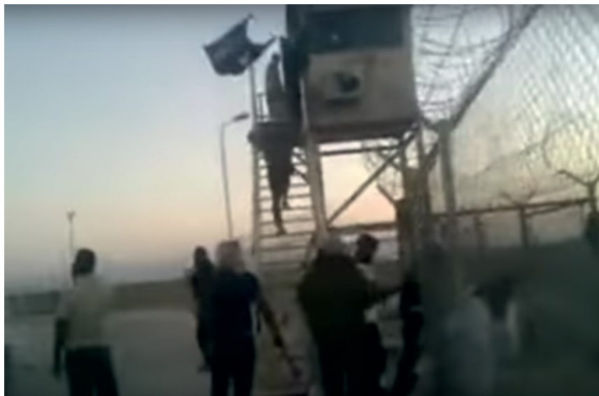
Imagen de captura de un vídeo de YouTube en la que se observa a miembros de comunidades locales escalandando un puesto de vigilancia al interior del Campamento Norte de la MFO tras haber traspasado el cerco perimetral del recinto, septiembre de 2012.

Con todo, resulta claro que estos diversos motivos han ocasionado, como mínimo, la pérdida de cientos de armas ligeras, miles de armas pequeñas y millones de municiones. En este informe se han incluido las pérdidas ocurridas en la operación conjunta de la UA y la ONU en Somalia, sin embargo aunque estas se hubieran omitido, esta importante conclusión seguiría siendo cierta. El Survey ha registrado la pérdida de armas y municiones en las misiones de al menos siete organizaciones ajenas a las Naciones Unidas