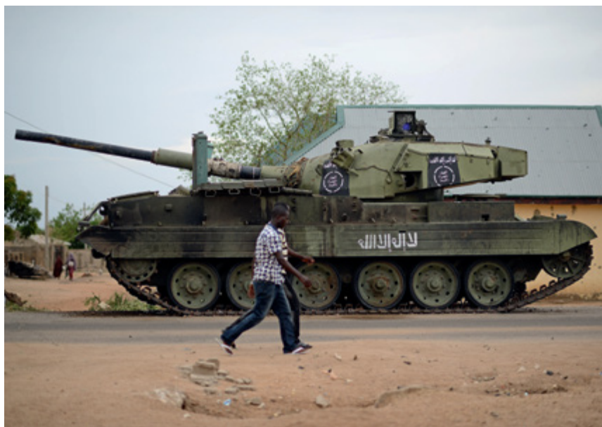
Tanque con la insignia de Boko Haram en Yola, Adamaua, tras su recuperación por parte del ejército de Nigeria, mayo de 2015.

cuando los ataques no cobran un número importante de víctimas, despiertan escaso interés en los medios de comunicación, y los TCC y los países que aportan fuerzas de policía (PCC, por sus siglas en inglés) tienen escaso incentivo para difundir este tipo de incidentes. Durante la década de los 90, fuerzas de paz que desempeñaban funciones de patrullaje (como también en convoyes y puestos fijos) en misiones de la CEDEAO en Liberia y Sierra Leona fueron víctimas de ataques que ocasionaron la pérdida de armas y municiones. 27 Fuera de África, un patrullaje de la OTAN a cargo de efectivos de un TCC perteneciente a una Fuerza Internacional de Asistencia para la Seguridad (FIAS) en Afganistán fue víctima, en agosto 2008, de un ataque en el cual diez soldados resultaron muertos (Smith, 2018). El Survey supone que los talibanes incautaron al menos diez armas, ya que el TCC afectado no pudo recuperar los cuerpos de sus soldados sino hasta el día siguiente (Smith, 2018).