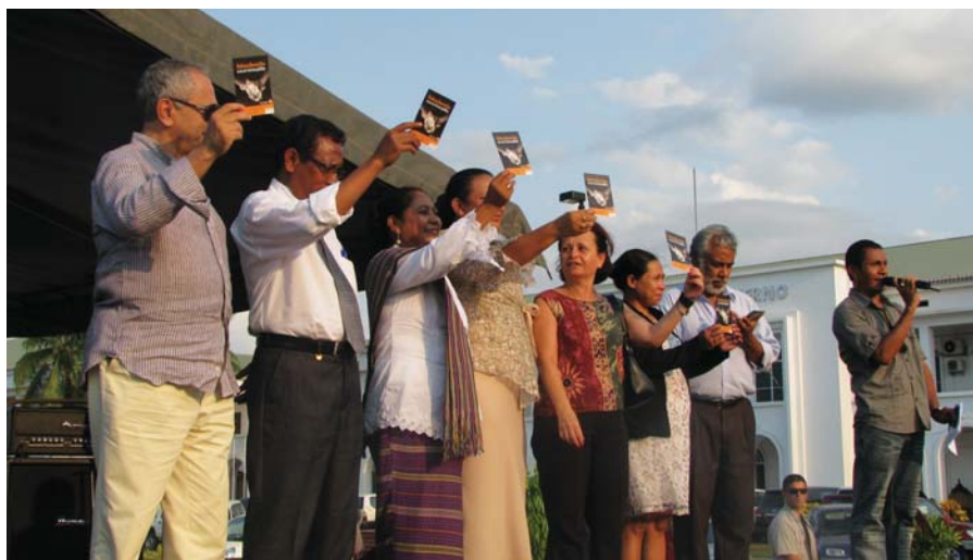
Em a inklui Prezidente Jose Ramos Horta (liman karuk) no Primeiru Ministru Xanana Gusmao (liman loos) ho postál ne'ebé sira asina hodi apoia aprovasaun Lei kontra Violensia Doméstika, 3 Novembru 2009.

ladún di'ak nafatin. Liu metade (51%) husi sira ne'ebé tuir inkéritu iha 2003 konkorda maka'as katak 'mane ida iha razaun di'ak atu baku nia ferik-oan bainhira la tuir ninia hakarak'. 47 Tanba ne'e, bele hatene katak iha motivausaun uitoan de'it atu buka ajuda hodi trata violénsia. Maizumenus 45% husi respondente konkorda maka'as ho deklarasaun katak 'problema família tenke diskute de'it ho membru família' no 51% husi fetu sente katak opsaun di'ak liu hotu iha sira-nia situasaun mak buka apoia husi sira-nia família. Maioria fetu ne'ebé la buka ajuda ba violénsia hasoru parseiru íntimu ka membru família ba de'it sira-nia família (32%), maski proporsaan ki'ik liu (5%) buka 'justisa tradisionál' ka polísia (3%), ka hakarak haluha de'it (9%). 48