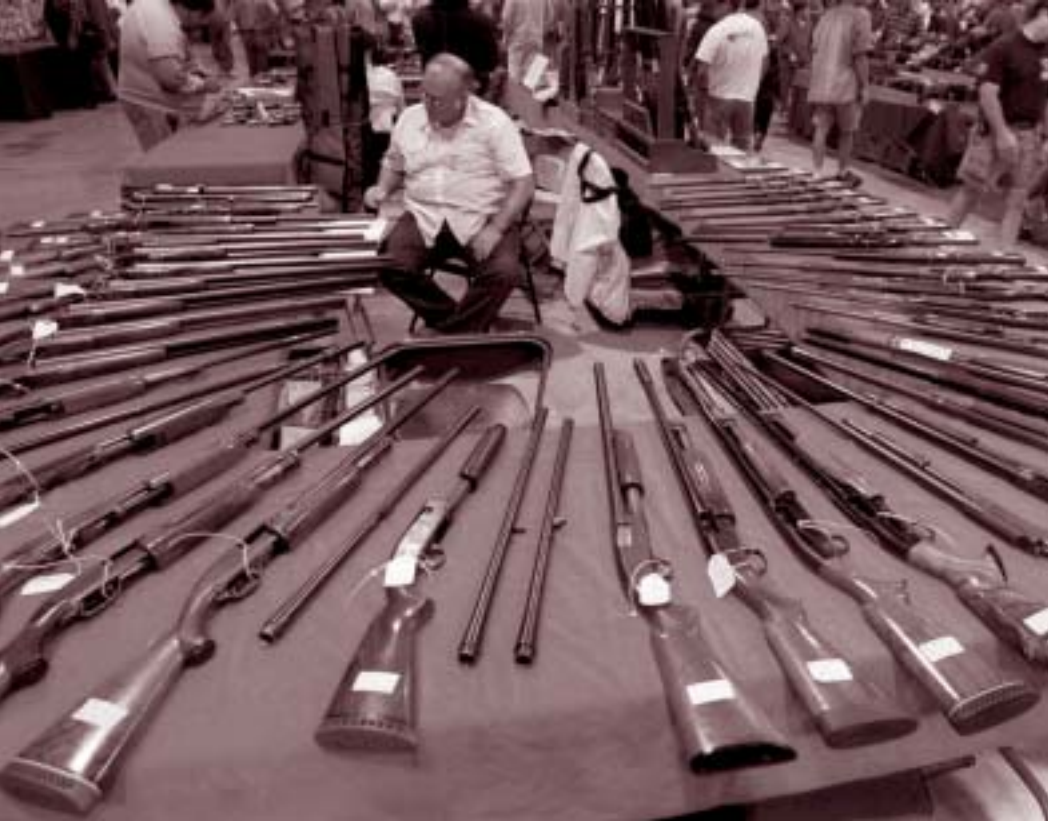
أسلحة صغيرة للبيع-كاليفورنيا

يعطي هذا الفصل تحديث سنوي، ومعلومات جديدة و أبحاث عن إنتاج الأسلحة الصغيرة العالمي، وتتضمن التوزيع العالمي لهذا الإنتاج، وقيمة وحجم الإنتاج.