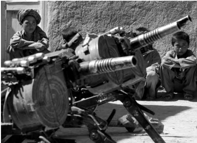
Афганские дети рядом с автоматическими гранатометами, переданными местными жителями представителям ООН в рамках добровольной сдачи оружия

Другие регионы, по сути, все еще остаются белыми пятнами на карте мировых запасов оружия. В этом плане особенно важным является Китай. Нет твердых данных в отношении Ближнего Востока, за исключением Израиля и Иордании.