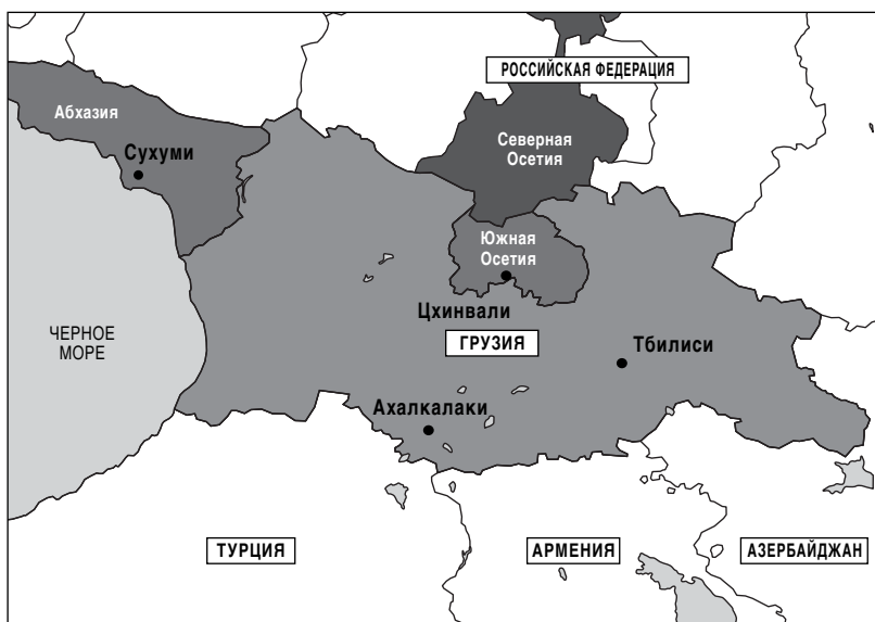
Карта 6.1. Республика Грузия

Во время конфликтов периода обретения Грузией независимости ситуация с доступностью стрелкового оружия резко менялась. В ранний период, с 1989-го до середины 1991 года, было доступно небольшое количество стрелкового оружия и источники его поставок в основном были не военными. Однако с середины 1991 года и далее шел процесс разрушения государственных институтов, в том числе структур российских Вооруженных сил в Грузии. Неожиданно стрелковое оружие стало широкодоступным из-за крупных "утечек" оружия с российских военных баз и из-за расширения региональной торговли, в которой участвовали Азербайджан и Армения, что выразилось в снижении цен на оружие после 1991 года.