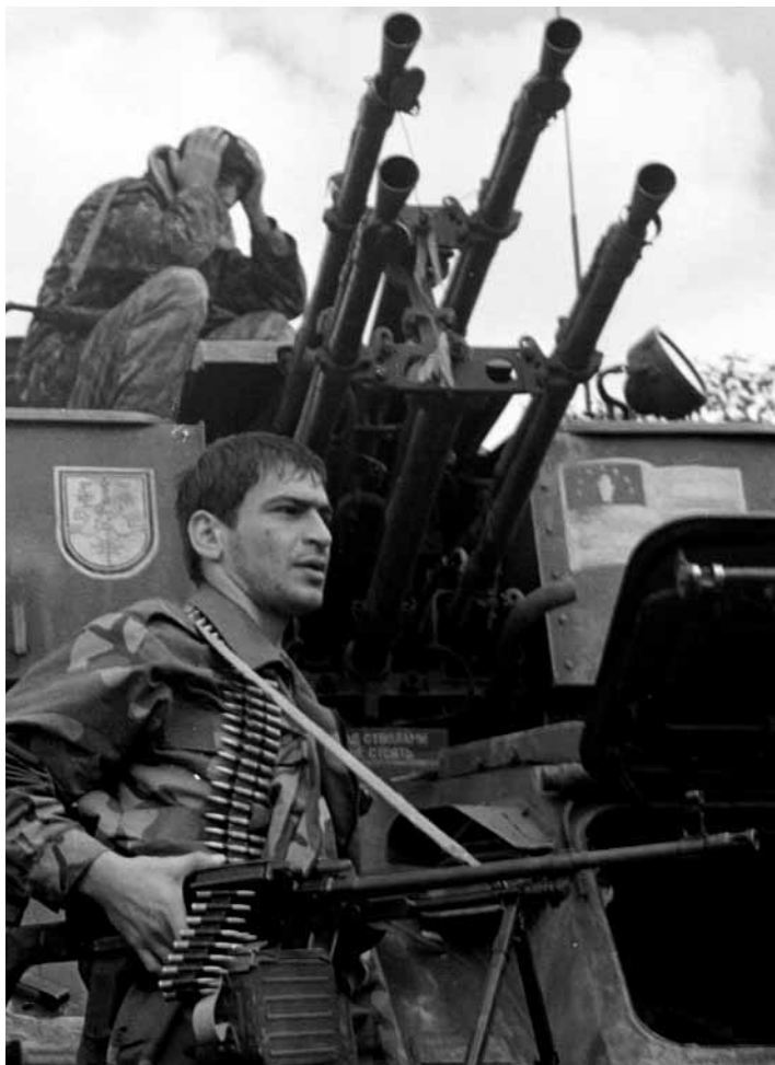
Абхазский солдат в Кодорском ущелье, разделяющем Абхазию и Грузию

Как и большинство военных конфликтов, которые сопровождали окончание "холодной войны", борьба Грузии за независимость состояла не из одного вооруженного конфликта, а из серии накладывающихся друг на друга этнических и политических конфликтов, в том числе гражданской войны, грузино-осетинского и грузино-абхазского конфликтов. Эти вооруженные конфликты не были самыми длинными и кровопролитными войнами начала 1990-х годов, однако большое влияние на них оказали бесконтрольное распространение и доступность стрелкового оружия.