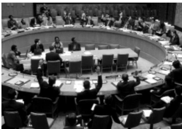
Le Conseil de sécurité des NU vote à l'unanimité la résolution 1343, qui impose un nouvel embargo sur les armes au Libéria en réponse à son soutien aux rebelles armés du Sierra Leone (7 mars 2001).

Il existe également en Afrique du sud une norme sur la destruction d'armement pour les armes à éliminer qui semble rencontrer une audience favorable, même avec certaines restrictions. L'application du Protocole SADC a connu un franc succès grâce à l'efficacité de mécanismes déjà existants en terme de coopération régionale, dont l'approche sur les armes légères ne bénéficie pas encore.