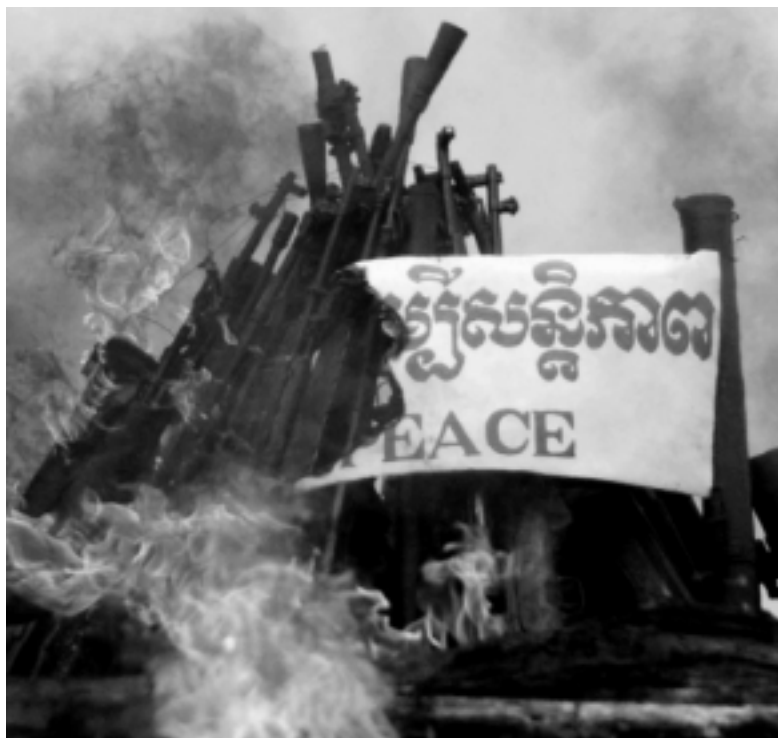
Environ 7.000 armes ont été brûlées au Cambodge pour marquer le début de la Conférence des Nations unies sur les armes légères (9 juillet 2001)