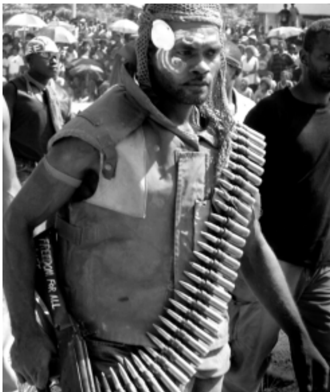
Dans les Iles Salomon, en août 2003, un ancien membre de la Malaita Eagle Force continue de porter son fusil après que le mouvement ait accepté de restituer ses armes.