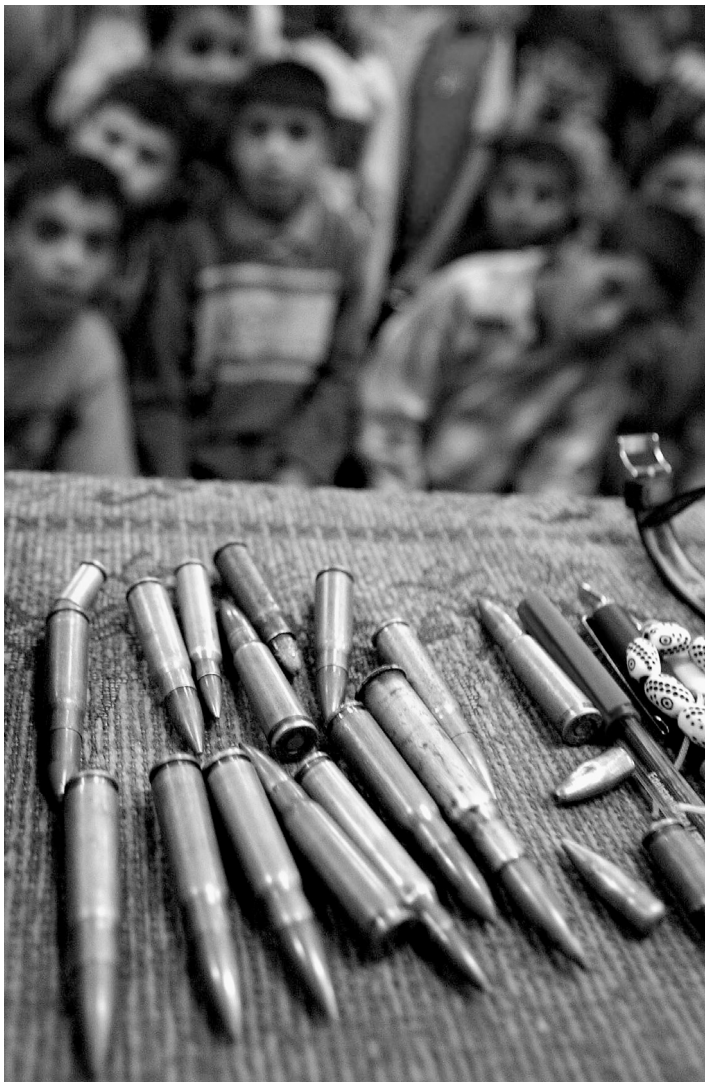
Des enfants palestiniens, les yeux rivés sur des balles offertes par des activistes du Hamas lors d'une campagne dans la bande de Gaza en avril 2004.

Sans munitions, les armes légères sont privées de leur pouvoir de menacer, de blesser et de tuer. Ce simple fait suggère que la communauté internationale, qui s'inquiète de l'impact de la violence armée sur la sécurité des personnes, se doit de prêter autant d'attention au projectile qu'à l'arme utilisée pour le tirer. En dépit de leur rôle essentiel dans les conflits, les munitions ont été jusqu'à présent ignorées dans le débat sur le contrôle des armes, et ce malgré les premiers efforts entrepris dans ce sens en 1999 par le groupe d'experts des Nations Unies chargé de la question des munitions et des explosifs.