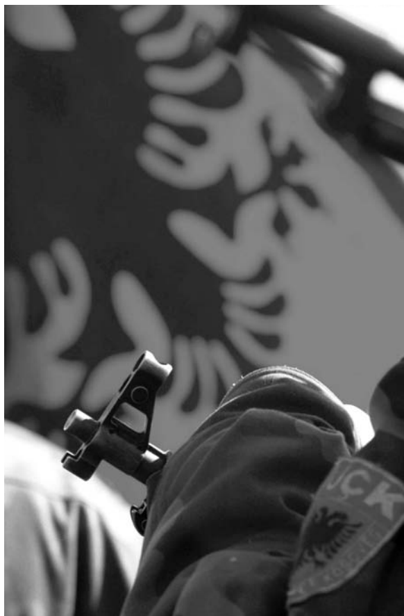
Le drapeau albanais flotte derrière un fusil tenu par un combattant de l'UCK lors d'une cérémonie à Likonase, au Kosovo, en février 1999.