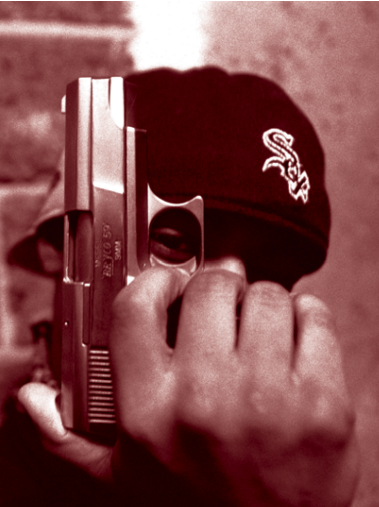
Un jeune membre de gang brandit son 9 mm dans le couloir d'une cité à Brooklyn, New York, en décembre 2003.

Les jeunes hommes armés sont peut-être les éléments les plus craints dans toutes les sociétés, mais ils ont eux-mêmes beaucoup à craindre. Quel que soit le pays dans lequel ils vivent, les hommes jeunes représentent une part disproportionnée des auteurs et des victimes de la violence mortelle liée aux armes à feu. Les garçons ont deux à trois fois plus de chances que les filles d'être impliqués dans des bagarres. Les hommes jeunes —c'est-à-dire ceux âgés de 15 à 29 ans— représentent également la moitié des victimes d'homicides par armes à feu dans le monde, soit entre 70 000 et 100 000 morts par an.