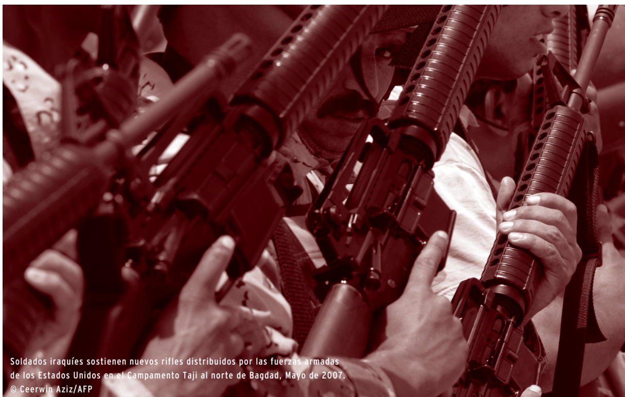
Soldados iraquíes sostienen nuevos rifles distribuidos por las fuerzas armadas de los Estados Unidos en el Campamento Taji al norte de Bagdad, Mayo de 2007.

El presente capítulo aporta un análisis detallado de los datos disponibles sobre las armas de fuego, y constituye la primera etapa de un proyecto a largo plazo destinado a analizar todos los componentes del comercio internacional de armas pequeñas y ligeras. Según los datos aduaneros suministrados a la Base de Datos Estadísticos de la ONU sobre el Comercio de Mercaderías (Comtrade ONU), el comercio de las tres principales categorías de armas de fuego (escopetas y rifles deportivos y de caza, pistolas y revólveres, y armas de fuego de uso militar) se elevaba a aproximadamente 1,44 mil millones de dólares en 2006. Un estudio comparativo de los datos de Comtrade ONU y de información proveniente de otras fuentes, incluyendo el Registro de Armas Convencionales de la ONU (Registro de la ONU), así como informes nacionales y regionales sobre transferencia de armas en 53 países, revela que existen 140 millones de dólares adicionales producto de transferencias de armas de fuego no incluidas en los datos aduaneros. Por consiguiente, el Small Arms Survey estima que la transferencia autorizada y documentada de armas de fuego en el mundo alcanzó 1,58 mil millones de dólares en 2006. El comercio ilegal, que sigue siendo considerable a pesar de un aumento en el registro de transferencias de armas de fuego, podría representar al menos 100 millones de dólares (ver Recuadro 1.3 en el Capítulo).