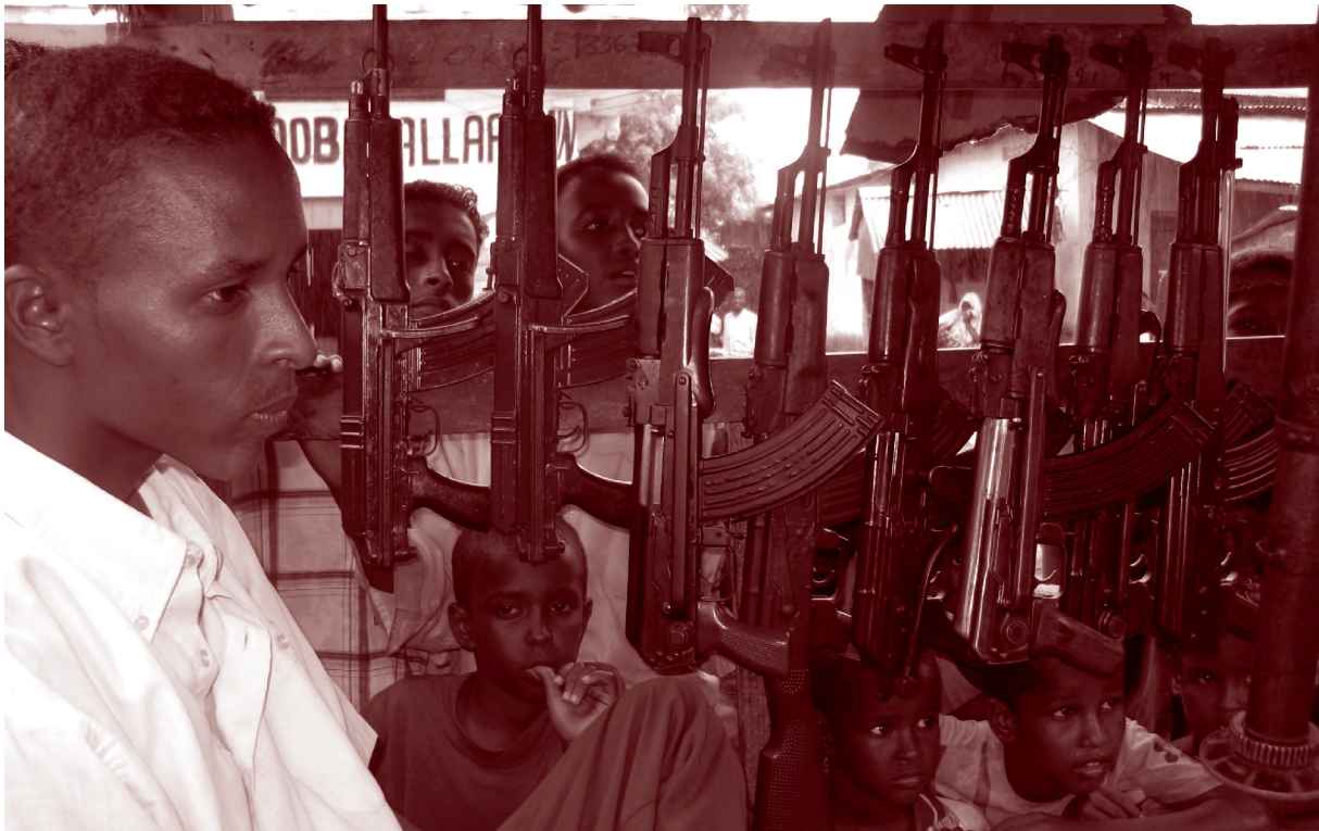
Étal d'un marchand d'armes dans le marché de Bakara, qui a commencé son activité à l'âge de 10 ans, Mogadishu, Somalie, juin 2006.