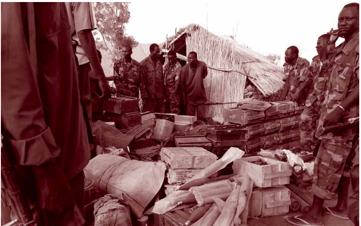
SPLA-N-Kämpfer bewachen Waffen und Munition, die sie von den Sudan Armed Forces (SAF) erbeutet haben, nahe dem Dorf Gos in den Nuba-Bergen, Süd-Kurdufan, Sudan, Mai 2012.

Über die Jahre sind auch die militärischen Verbindungen zwischen Iran und Sudan stark gewachsen. Nach der UN Comtrade kamen 13 Prozent der Waffenimporte in den Jahren 2001 bis 2012 aus dem Iran, nach Angaben in eigenen Waffenimportberichten aus Khartoum. Dazu zählten RPG-7-artige Raketenwerfer, Antipersonen-Landminen Nr. 4, Mörser-Ladungen und -Rohre sowie Munition der Kaliber